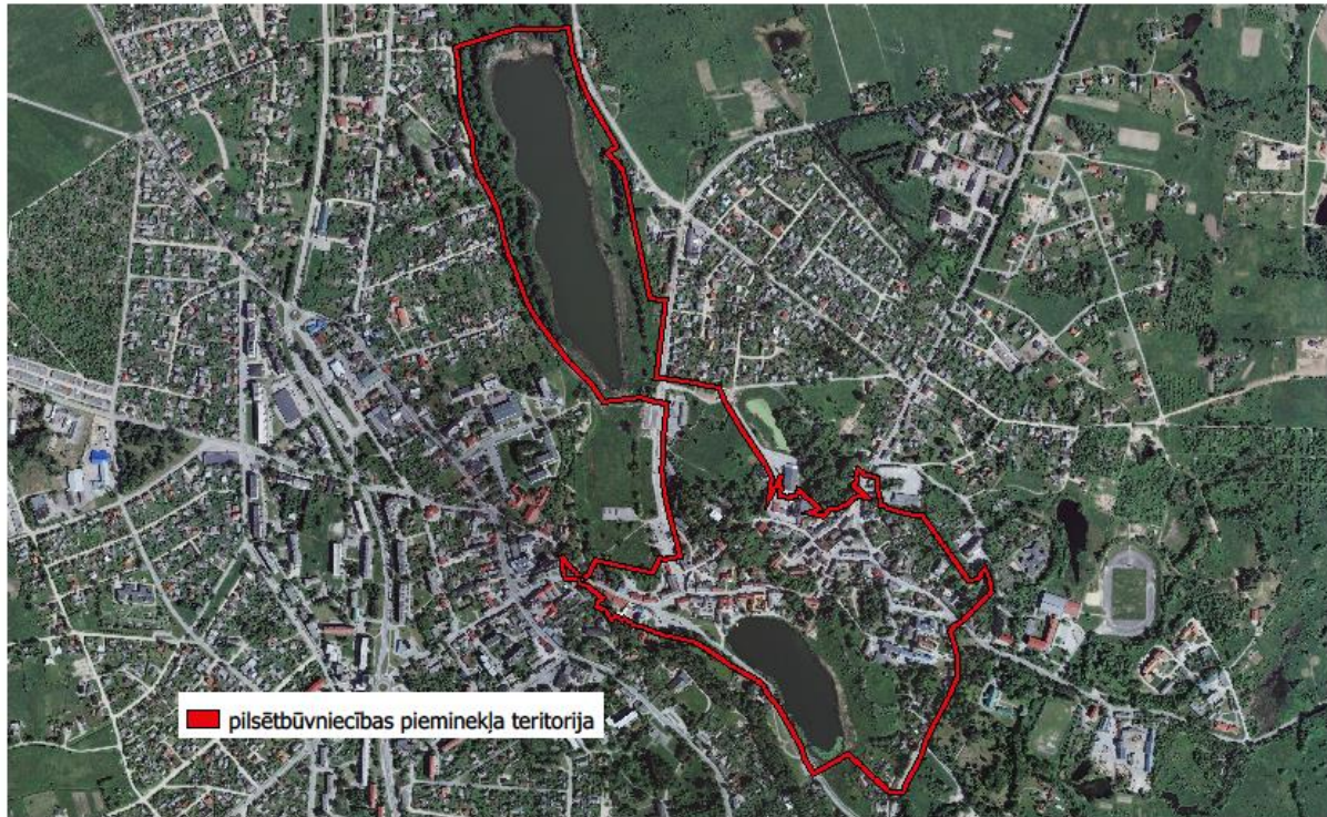
Valsts nozīmes pilsēt būvniecības pieminekļa "Talsu pilsētas vēsturiskais centrs" teritorija

Pielikums Nr. 3 saistošajiem noteikumiem Nr.22 „Par Talsu novada pašvaldības līdzfinansējumu valsts nozīmes pilsēt būvniecības pieminekļu teritorijās esošo ēku restaurācijai un konservācijai Talsu novadā”